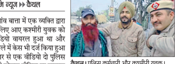
कैथल। पुलिस कर्मचारी और कश्मीरी युवक।

कुछ दिन पहले गांव बाता में एक व्यक्ति द्वारा कपड़ा बेचने के लिए आए कश्मीरी युवक को धमकाने का वीडियो वायरल हुआ था और पुलिस ने इस मामले में केस भी दर्ज किया हुआ है। अब इसी प्रकार से एक वीडियो दो पुलिस कर्मचारियों का भी सोशल मीडिया पर वायरल हो रहा है। इस वीडियो में दोनों पुलिसकर्मी एक मुस्लिम कश्मीरी कपड़ा बेचने वाले युवक को धमका नहीं रहे, बल्कि उसके प्रति भाईचारा प्रदर्शित करते दिखाई दे रहे हैं। वीडियो में पगड़ी पहने हुए एक सिख पुलिसकर्मी पंजाब के गायक गुरदास मान का गाना गाते हुए दिखाई दे रहा है। कश्मीरी युवक से बातचीत करते हुए दोनों पुलिसकर्मी उसे कहते हैं कि कुछ दिन पहले कैथल के गांव बाता में एक व्यक्ति ने कश्मीरी