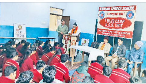
नरवाना। शिविर को संबोधित करते हुए वक्ता।