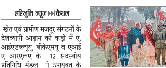
कैथल। डीसी को ज्ञापन देने पहुंचे खेत व मजदूर संगठनों के पदाधिकारी।