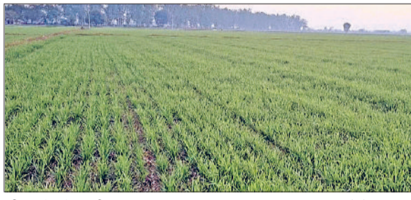
जींद। खेत में खिली फसल।