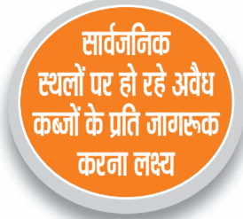
हरिभूमि न्यूज ॥ जीद