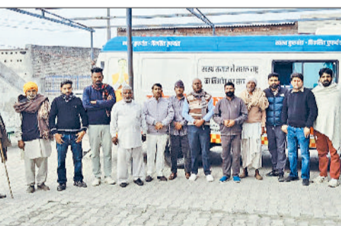
सीवन। गांव रसूलपुर में पहुंची मेडिकल वेन।