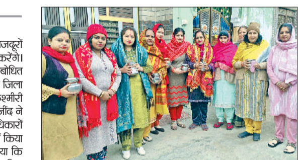
उचाना। सकट चौथ व्रत कथा के लिए एकत्रित हुई महिलाएं।