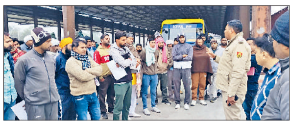
कैथल। यातायात नियमों बारे जागरूक करते पुलिस कर्मचारी।