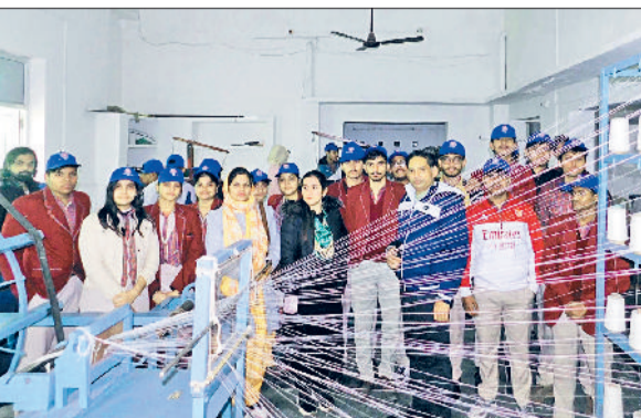
जीद। सरस्वती खादी ग्रामोद्योग का शैक्षणिक भ्रमण करते हुए।

डीएवी शताब्दी पब्लिक स्कूल की एनएसएस यूनिट द्वारा आयोजित किया जा रहे सात दिवसीय विशेष शिविर के छठे दिन स्वयंसेवकों ने सरस्वती खादी ग्रामोद्योग जीद का शैक्षणिक भ्रमण किया गया। इसका उद्देश्य विद्यार्थियों को स्वदेशी, आत्मनिर्भर भारत एवं ग्रामीण