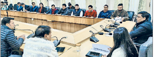
जीद। बैठक में दिशा-निर्देश देते हुए डीसी।