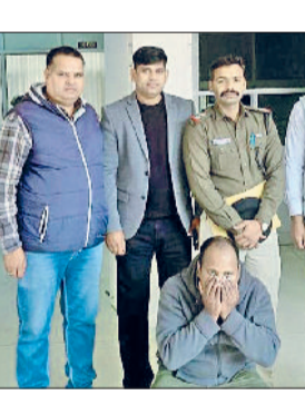
कैथल। दोनो आरोपी थाना साइबर क्राइम गिरफ्त में।