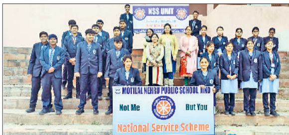
जीद। कार्यक्रम के दौरान मौजूद मोतीलाल स्कूल के बच्चे।

मोतीलाल नेहरू पब्लिक विद्यालय में आयोजित सात दिवसीय राष्ट्रीय सेवा योजना शिविर के छठे दिन विद्यार्थियों को समाज, संस्कृति एवं पर्यावरण से जोड़ने के उद्देश्य से एक विशेष जागरूकता कार्यक्रम का आयोजन किया गया। कार्यक्रम के तहत एनएसएस के स्वयंसेवकों को विद्यालय के समीप स्थित गांव में ले जाया गया, जहां उन्हें गांव की ऐतिहासिक एवं सांस्कृतिक धरोहरों से परिचित कराया गया तथा उनके संरक्षण के महत्व पर विस्तार से जानकारी दी गई। कार्यक्रम के दौरान विद्यार्थियों ने गांव में स्थित प्राचीन तालाब का भ्रमण किया। स्वयंसेवकों को बताया गया कि तालाब केवल जल संग्रहण का साधन नहीं होते बल्कि ये गांव की जीवनरेखा होते हैं। तालाब वर्षा जल संरक्षण, भूजल स्तर बनाए रखने, पशु पक्षियों के लिए जल स्रोत तथा पर्यावरण संतुलन बनाए रखने में