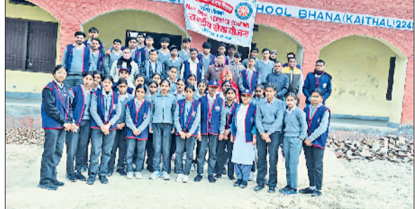
राजौड़। शिविर समापन के दौरान विद्यार्थी व स्टाफ सदस्य।

ने इस अवसर पर कहा कि खादी और ग्रामोद्योग भारतीय संस्कृति, श्रम के सम्मान और आत्मनिर्भरता की पहचान हैं। उन्होंने कहा कि ऐसे शैक्षणिक भ्रमण विद्यार्थियों में स्वदेशी वस्तुओं के प्रति सम्मान और समाजसेवा की भावना विकसित करते हैं।