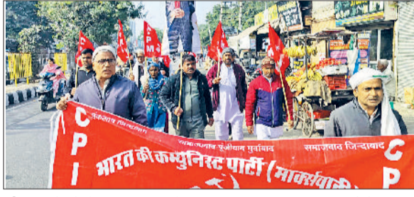
जीद। मांगों को लेकर प्रदर्शन करते कार्यकर्ता।